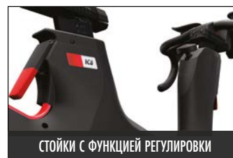
СТОЙКИ С ФУНКЦИЕЙ РЕГУЛИРОВКИ