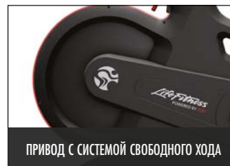
ПРИВОД С СИСТЕМОЙ СВОБОДНОГО ХОДА