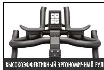
ВЫСОКОЭФФЕКТИВНЫЙ ЭРГОНОМИЧНЫЙ РУЛЬ