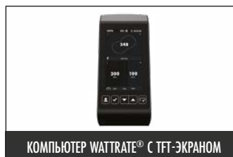
КОМПЬЮТЕР WATTRATE® С TFT-ЭКРАНОМ