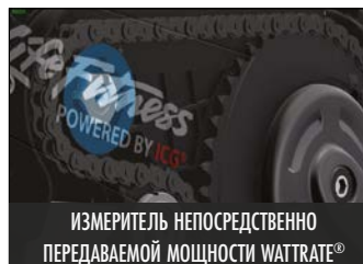
ИЗМЕРИТЕЛЬ НЕПОСРЕДСТВЕННО ПЕРЕДАВАЕМОЙ МОЩНОСТИ WATTRATE®